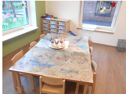
Wir haben einen großen Basteltisch