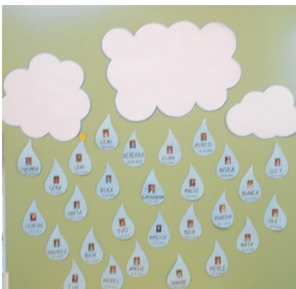
Auf unserem Geburtstagskalender können wir immer sehen, wer als nächstes Geburtstag hat.

Jeden Tag besprechen wir im Morgenkreis unseren Wochenplan und erzählen, was wir an einem Tag vorhaben.